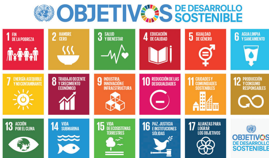
Figura 1. Objetivos de Desarrollo Sostenible

Los ODS reconocen explícitamente el rol fundamental que las empresas pueden y deben desempeñar en su logro.